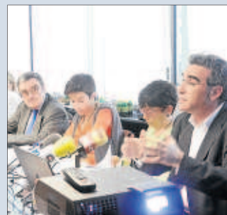
La presentació, ahir, del POUM als mitjans de comunicació

L'avanç del Pla proposa treure fins a 8.000 habitatges en zona urbanitzable amb la qualificació de delimitat-unes 164 hectàrees- i convertir-los en no delimitat, condicionant així el seu desenvolupament i la seva posada al mercat al fet que el promotor privat contribueixi a desenvolupar, a canvi, actuacions de rehabilitació al Centre Històric. S'estableix una nova política d'inversió al Centre Històric basada en l'aportació, compensació o càrregues de les operacions urbanístiques. Així, l'aposta pel Centre Histò-