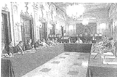
La proposta del desplegament urbanístic de la ciutat pel 2015-30

bisbes de grans ciutats de tot el món, que del 24 al 26 de novembre es trobaran a Barcelona per debatre-les a fons i fer-ne un informe final, que serà presentat l'endemà, 27 de novembre, al Papa Francesc en audiència al Vaticà. Encara falta la confirmació d'alguns assistents a la segona fase, però ja està assegurada la presència dels arquebisbes de Londres, Lisboa, Budapest, Rio de Janeiro, Sao Paulo, Bogotà, Tegucigalpa, Bombay, Manila, Shangai i Kinshasa, entre altres.